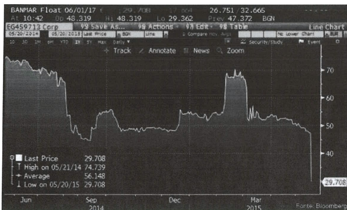
Immagine 1: I bond di Banca Marche, che già quotavano al 50% del nominale, sono precipitati a 29 centesimi dopo la notizia del mancato rimborso del prestito di 1,8 miliardi di euro erogato dal Credito Fondiario.

La crisi economica e internazionale ha comportato un deterioramento della qualità del credito delle banche, alimentando flussi di nuove sofferenze e incagli mettendo a rischio la stabilità degli istituti, specialmente di quelli medio/piccoli.